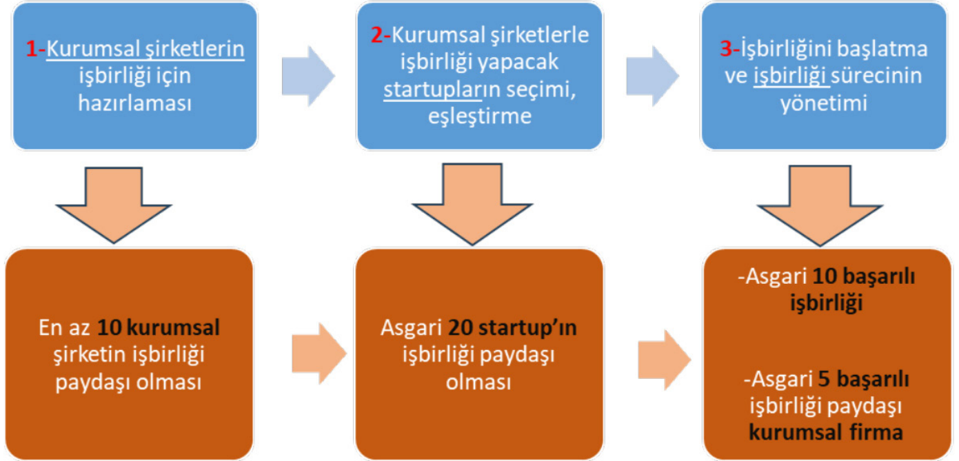
Şekil 2: Ana İş Paketleri ve Asgari Başarı Kriterleri Matrisi

Nihai ödeme öncesi, asgari başarı kriterlerinin karşılanmış ve bunların raporlanarak kanıtlanmış olması beklenmektedir. Nihai raporda "Hedefler ve nihai ödeme için asgari başarı kriterleri" altında yer alan 2 asgari başarı kriterlerini karşılamayan projelere nihai ödeme yapılmayacaktır.