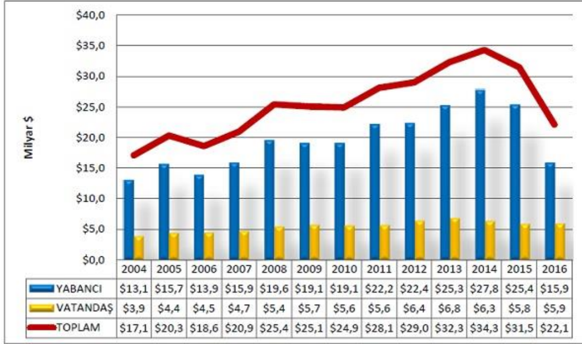
Grafik 3 - Yabancı Ziyaretçi ve Yurt Dışında İkamet Eden Vatandaş Ziyaretçi Turizm Gelirlerinin Yıllara Göre Dağılımı 9

Turizm sektörü, sosyal, çevresel, ekonomik ve siyasi olaylar gibi farklı dış ve iç etmenlere karşı oldukça hassas bir yapıya sahip olması nedeniyle; çevresel ve ekonomik kriz, terör ve savaş gibi olaylardan en hızlı ve en çok etkilenen sektörlerin başında yer almaktadır (Hacıoğlu ve Saylan, 2014). Hırsızlık, gasp, adam yaralama, ekonomik kriz, terör, savaş ve benzeri gibi yaşanan olumsuz olaylar da turizmi ve ziyaretçilerin taleplerini çok büyük oranda etkilediği görülmektedir (Polat, 2019: 1). Destinasyon imajı, potansiyel turistlerin destinasyona dönük beklentilerinin ve algılarının bütünü biçiminde ifade edilebilir (Murphy vd., 2000; Akyurt ve Atay, 2009). Ziyaretçilerin, gidecekleri varış yerini tercih etme nedenleri arasında destinasyon imajı ilk sıralarda yer almaktadır (Kozak, 2010). Herhangi bir destinasyonda, turistlerin maruz kaldığı hırsızlık, gasp, adam yaralama, meydana gelen iç karışıklıklar sonucunda, bölgenin güvenlik imajının zarar görmesinin yanı sıra destinasyona ait turizm taleplerinde de düşüşlerin ortaya çıkması olası bir durum olmaktadır (Seçilmiş ve Ünlüönen, 2009: 69). Turistik destinasyonlarda turistlere yönelik gerçekleştirilen suçlar, turizm destinasyonunu olumsuz biçimde etkileyebilmekte ve turistler açısından güvenlik problemi olduğu düşünülen destinasyonlara istenilen ve beklenen oranlarda turist gelişlerine de engel teşkil edebilmektedir (Polat, 2019: 92). Turistlerin konaklayacağı veya